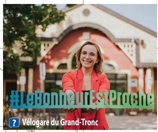
Vélogare du Grand-Tronc