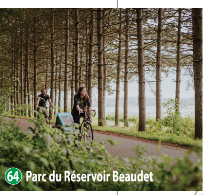
Apporte tes jumelles!