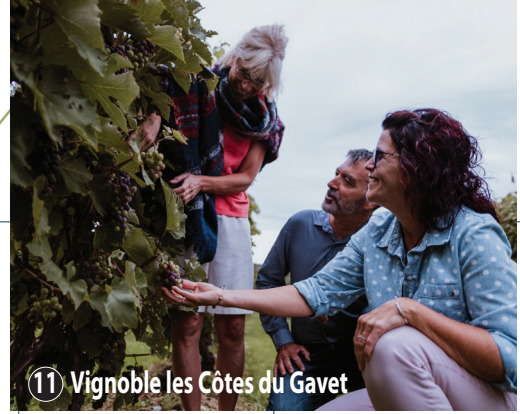
Vignoble les Côtes du Gavet