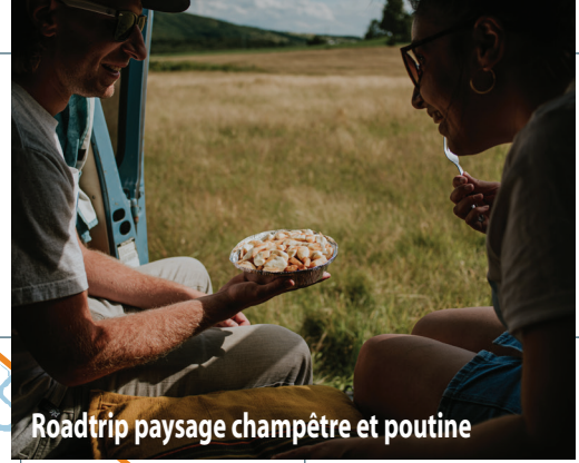
Roadtrip paysage champêtre et poutine