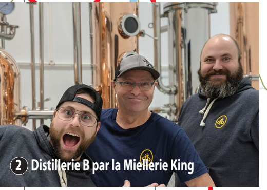
Distillerie B par la Miellerie King